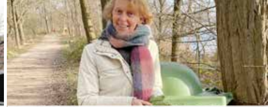
Zemst verkleint restafvalberg (p. 3)