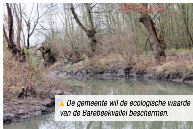
▲ De gemeente wil de ecologische waarde van de Barebeekvallei beschermen.

Alvast vier percelen in Elewijt werden aangekocht om het project op te starten. Twee aan de Nieuwlandstraat en twee tussen de Hofstraat en de E19. Samen twee hectare groot voor een aankoop prijs van goed 60.000 euro, waarvan de helft gesubsidieerd kan worden.